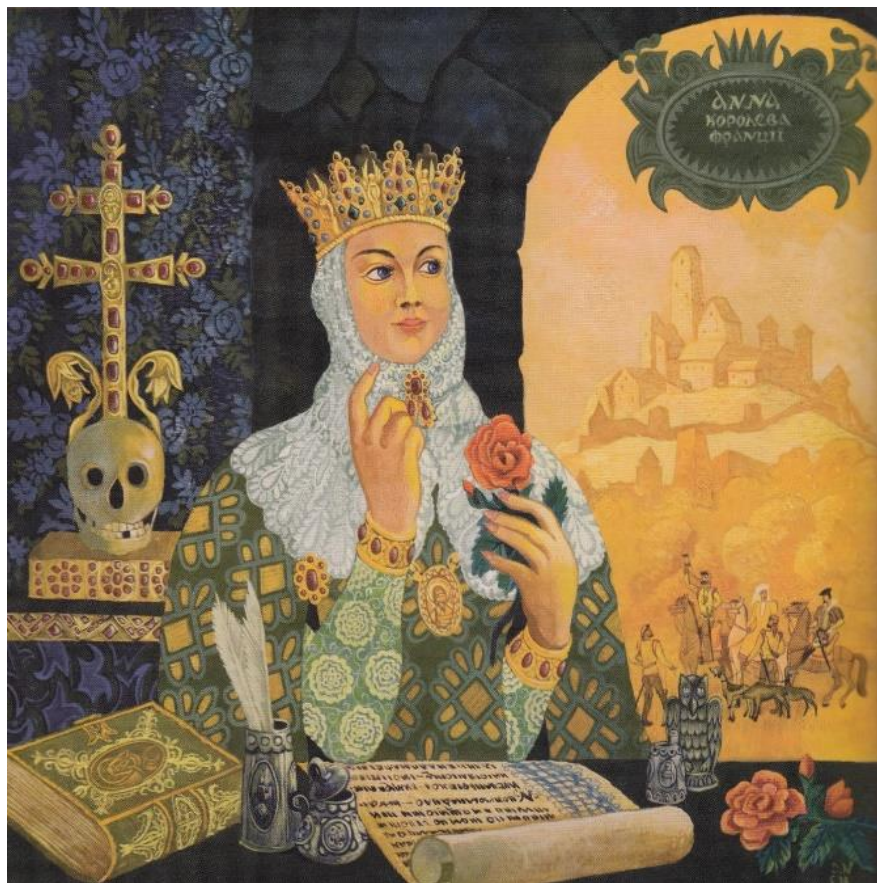
«Сага про Ярославових доньок. Ганна». 1989 р., полотно, темпера, 100х100. Черкаська філія «Укрінбанк»