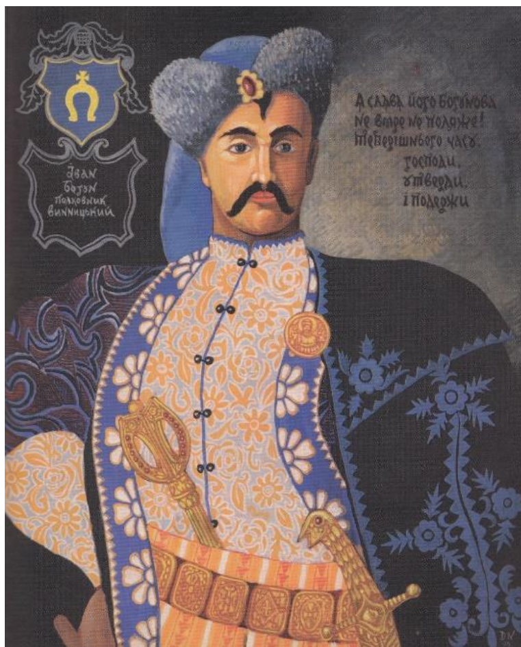
«Іван Богун – полковник Винницький». 1990 р., полотно, темпера, олія, 89х74. Черкаський обласний художній музей