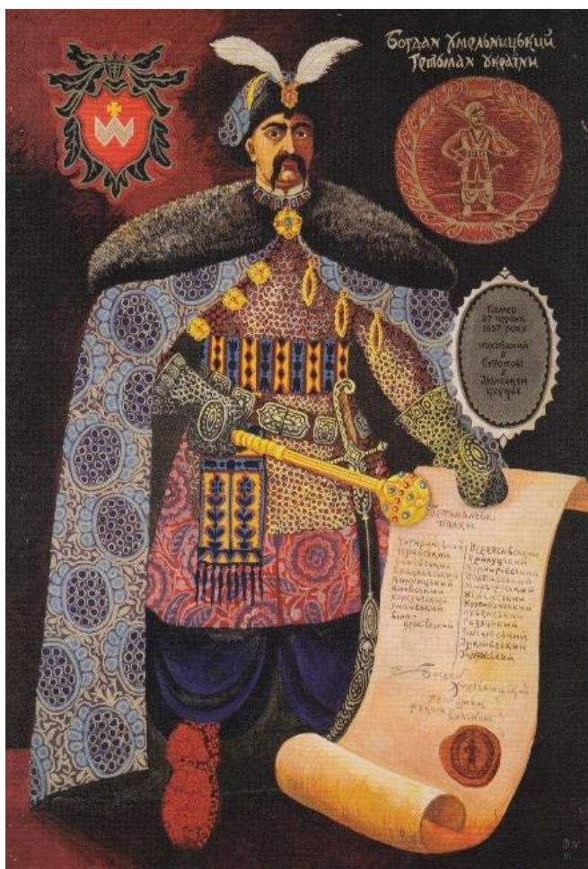
«Богдан Хмельницький – гетьман України». 1991 р., полотно, темпера, 130х90. Національний історико-культурний заповідник «Чигирин»